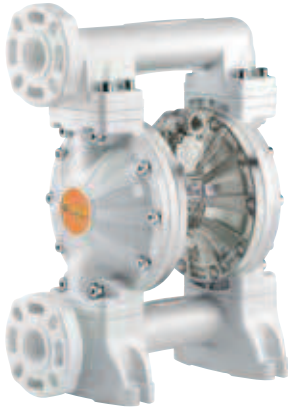
POMPA A MEMBRANA SERIE 1" 1000-PB DIAPHRAGM PUMP SERIES 1" 1000-PB