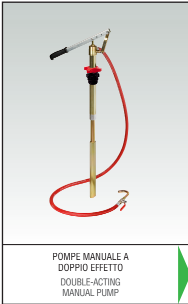
POMPE MANUALE A DOPPIO EFFETTO DOUBLE-ACTING MANUAL PUMP