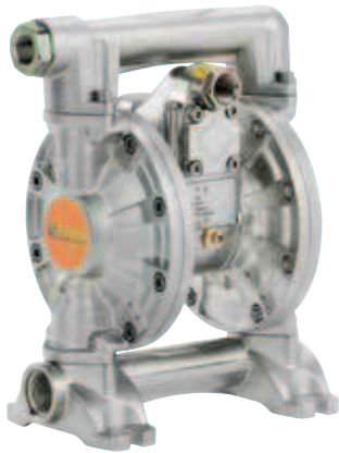
POMPA A MEMBRANA SERIE 1/2" 120-AB DIAPHRAGM PUMP SERIES 1/2" 120-AB