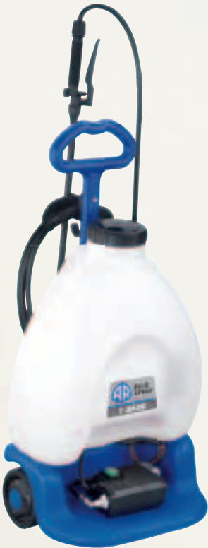
AR Blue Spray 1 Basic

AR Blue Spray 1 Basic Electric motor Brass lance with adjustable jet Outlet tube 4 m Motore elettrico Lancia ottone con getto regolabile Tubo mandata 4 m