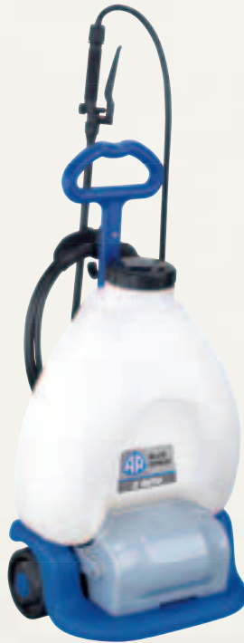
AR Blue Spray 2 Auto

AR Blue Spray 1 Basic Electric motor Brass lance with adjustable jet Outlet tube 4 m Motore elettrico Lancia ottone con getto regolabile Tubo mandata 4 m