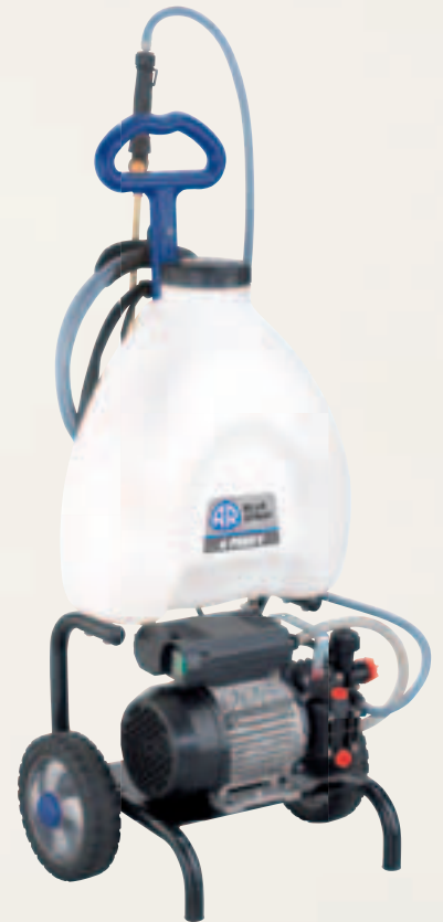
AR Blue Spray 4 Profy

AR Blue Spray 3 Motor Farmate model internal combustion engine Brass lance with adjustable jet Outlet tube 4 m By-pass system for the recirculation of product Motore a scoppio mod. Farmate Lancia ottone con getto regolabile Tubo mandata 4 m Sistema bypass per il ricircolo del prodotto