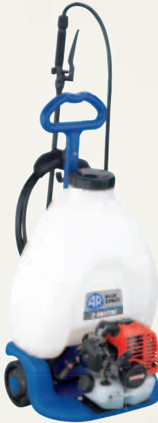
AR Blue Spray 3 Motor

AR Blue Spray 2 Auto Direct current electric motor Equipped with rechargeable battery Brass lance with adjustable jet Outlet tube 4 m Motore elettrico corrente continua dotata di batteria ricaricabile Lancia ottone con getto regolabile Tubo mandata 4 m