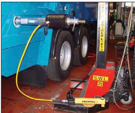
◀ RACH-306, jota käytetään P-392 käsipumpulla, käytetään keräysajoneuvojen ruostuneiden tappien vetämiseen.