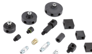
Liittimet ja jakokappaleet